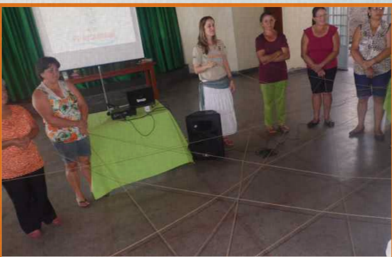
Curso Ecologia e Flora do Cerrado, destinado às agricultoras familiares de Ceres