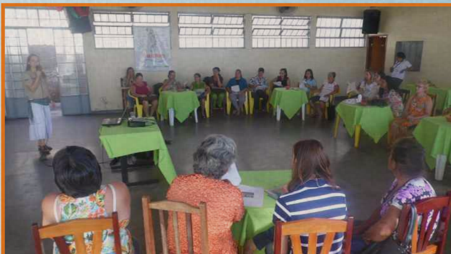
Engenheira Florestal do projeto expando sobre a Ecologia e a Flora do Cerrado