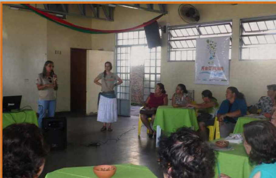
Curso Ecologia e Flora do Cerrado, destinado às agricultoras familiares de Ceres

A Ecologia é a Ciência que estuda as relações entre o homem e a natureza, objetiva a preservação dos recursos naturais, analisa o impacto das atividades humanas sobre o meio ambiente e procura soluções para evitar o desequilíbrio ecológico. Tal ciência é fundamental para a compreensão da flora do Cerrado, sendo esta possuidora de mais de dez mil espécies identificadas cientificamente, contendo, muitas delas, propriedades medicinais e outras são utilizadas na alimentação humana. A partir dessas informações o Projeto Pé de Cerrado, realizou no dia 29/05 no Sindicato dos Trabalhadores Rurais de Ceres, o Curso de Capacitação em Ecologia e Flora do Cerrado, para as Agricultoras Familiares do espaço rural do município de Ceres.