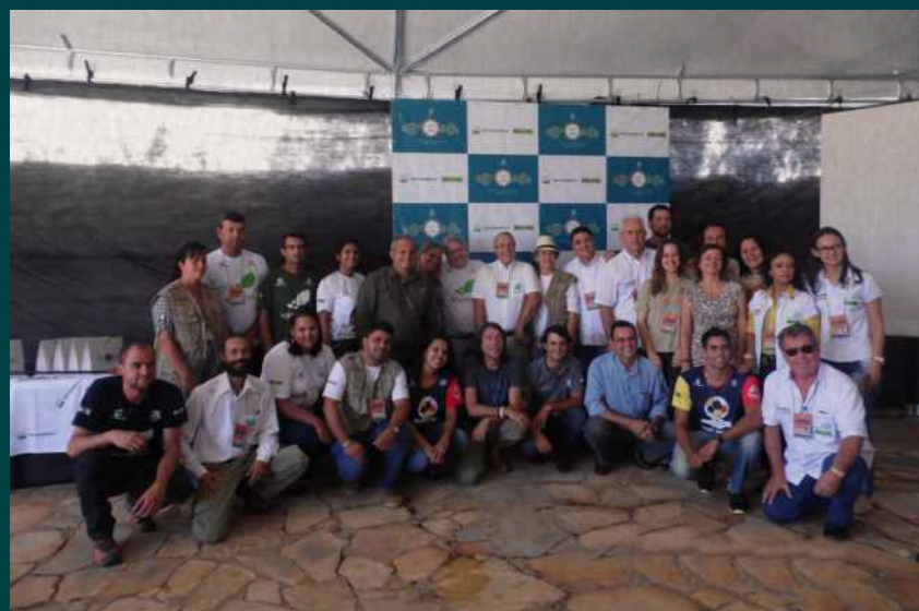
Projetos convidados, projeto anfitrião, Verde Vida e Lenine no “Encontros Socioambientais”