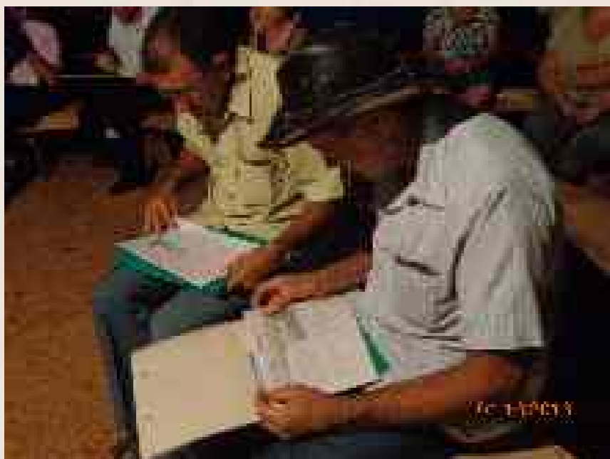
Agricultores abrindo o kit para participar da oficina.