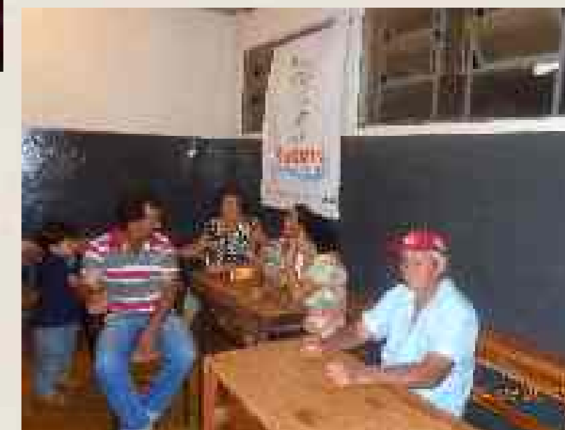
Agricultores de agricultura familiar na oficina realizada no Palmital/Palmitalzinho- Ceres/GO

No dia 24 de setembro, às 19 horas, na Associação dos Pequenos Produtores Rurais do Palmital/Palmitalzinho – Ceres – GO, foi realizada pela Equipe técnica do Projeto Pé de Cerrado, no espaço rural de Ceres – Palmital, a segunda oficina de diagnóstico socioambiental participativo.