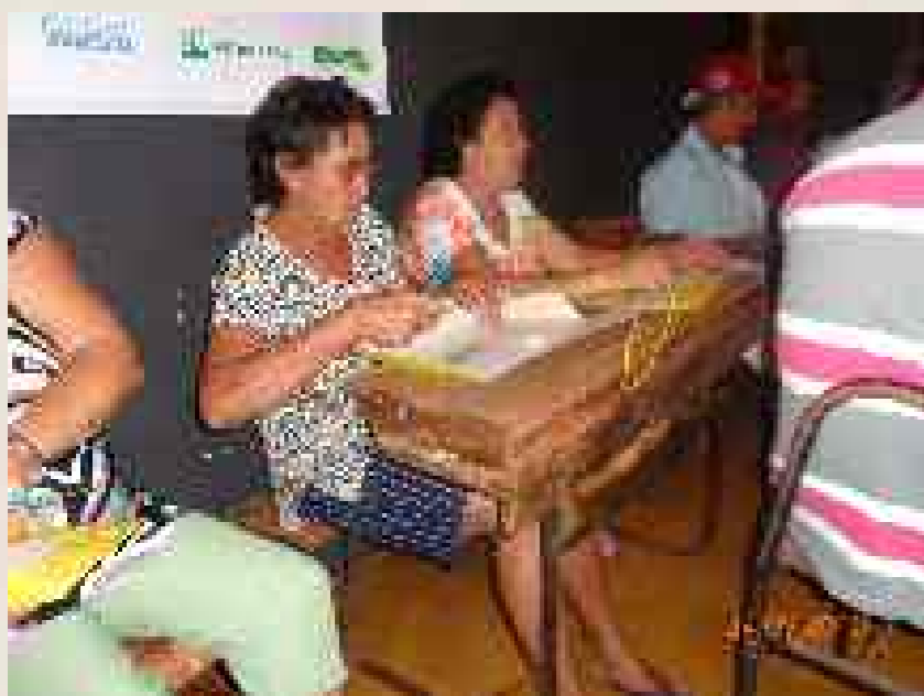
Comunidade do Palmital/Palmitalzinho na oficina do diagnóstico participativo do Projeto Pé de Cerrado.